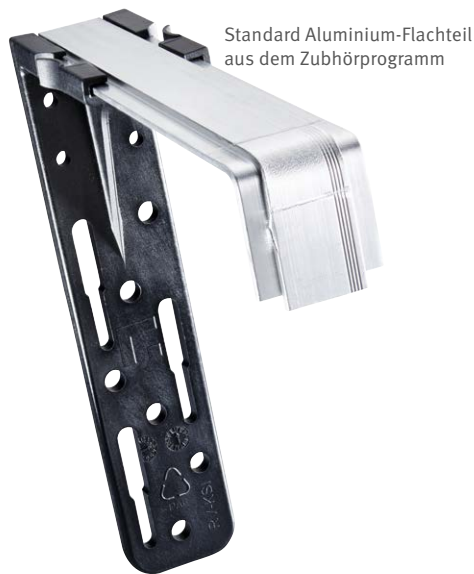
Standard Aluminium-Flachteil aus dem Zubehörprogramm

- EFFIZIENT UND WIRTSCHAFTLICH - NEUER FENSTERBANKHALTER MIT HOHEM WIRKUNGSGRAD