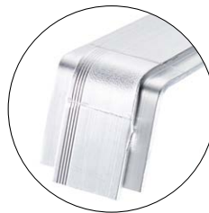
Klipsverbindung zur einfachen Befestigung