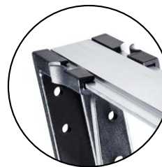
Stufenlos verstellbar mittels Spannfedern