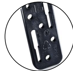
Grundkörper aus hoch- wertigem Polyamid-Kunststoff